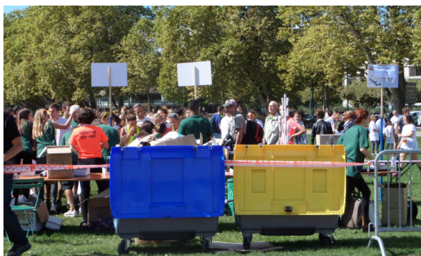
Course Color'Anancy - 2015

Les bacs de tri sont réservés aux organisateurs de la manifestation et ne sont pas accessibles au public.